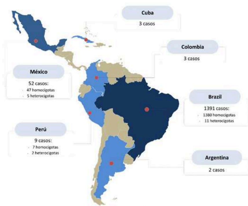
Diagrama de flujo para la búsqueda sistemática de casos de Ataxia de Friedreich en Latinoamérica

Si no se pone nada, se sobreentiende que es elaboración propia